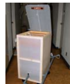
45ℓのゴミ袋が収まるよう計算され、車輪付きで移動も可能。この原理を利用し、わずかな力で自動開閉可能なフタを設置したことにより、臭いの拡散を防いだ。

寮のフロアごとに編成された 13 チームが、約 2 ヶ月間にわたり試行錯誤で作上げたそれぞれの「イノベーション」内容は、各個室の就寝状況をランプの点灯で確認できるシステムや、水車の原理を用いたダンボール製の米計量機など、