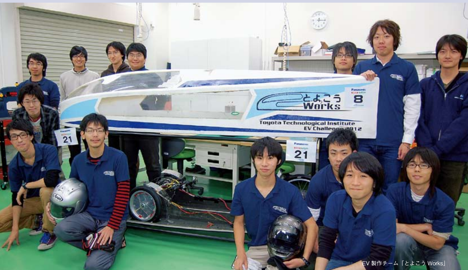
EV 製作チーム「とよこう Works」