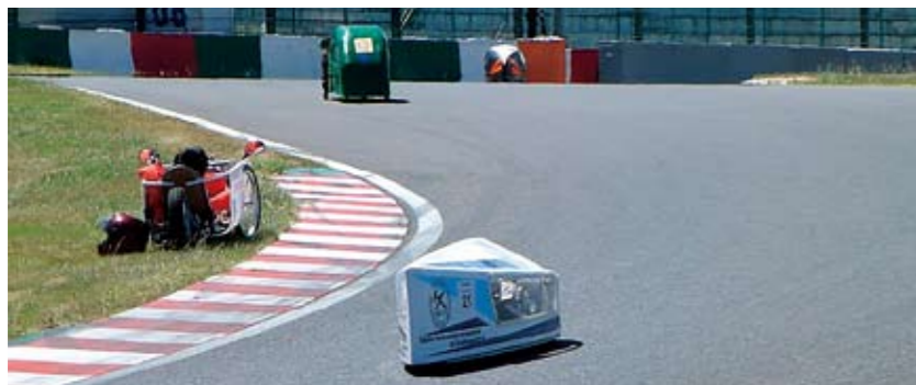
鈴鹿サーキットを走行する豊田工業大学のEVマシン(手前)

今回、車体、カウルからブレーキやバッテリー、モーターなどマシン全体を改良し、年度内に2つの大会に出場するべく、必要な物品の購入や工作費確保のため、アクティブチャレンジに申請しました。