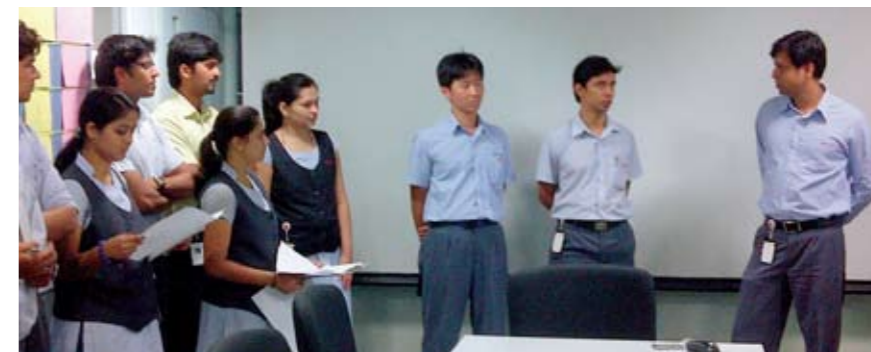
ミーティング風景