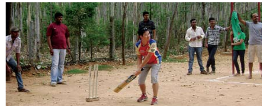
仲間たちとクリケットを楽しむ

もう一つ、分野を限定せず、色々なことに手を出すことも重要と考えながら学生生活を送っていました。「〇〇基礎」「〇〇入門」という教科を積極的に受講して、自分の引き出しを増やすことを意識していました。会社に入ってから、必ずしも自分の希望する仕事をやれるとは