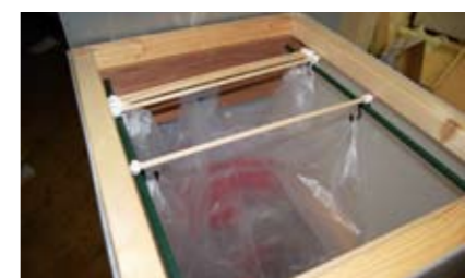
最大 10 枚のゴミ袋が収納可能。収納されたゴミ袋をスライドさせ、スムーズな交換ができる。

は、「フロアで共有するゴミ箱はすぐにゴミであふれかえるため、袋交換の手間を省きたかった。夏場に向けた臭い対策としても手を打つ必要があった」とテーマ設定の経緯を説明し、「自動傘袋入れの構造を調べ図面を書き、試作した」と製作過程を語った。