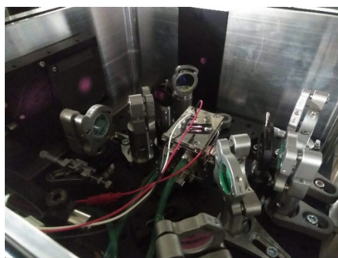
開発されたチタニウム固体レーザー再生増幅器の増幅部分