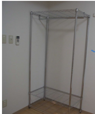
ハンガーラック 幅91cm × 奥行46cm × 高さ183cm