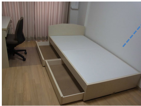
ベッド 幅104cm × 長さ199.5cm